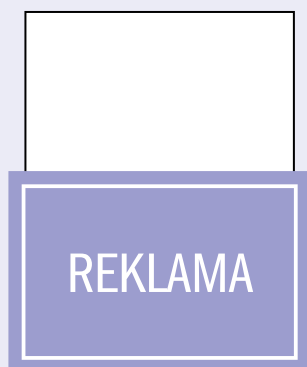
1/2 strony poziom